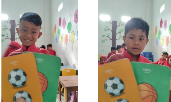
Gambar 4.4 Kegiatan Tindakan Siklus II