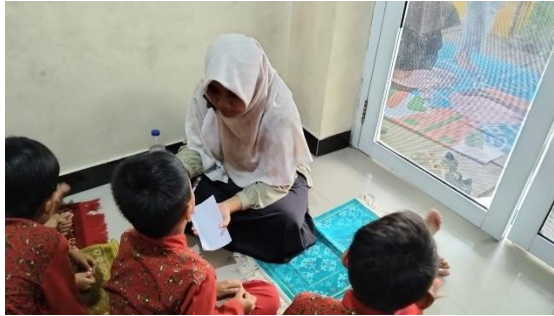
Gambar 4.2 Kegiatan Pratindakan

Berikut ini proses pembelajaran kegiatan menghafal Al-Qur'an dari pembukaan sampai pulang di kelompok usia 5-6 tahun RA AR-RIZQI Tangerang ialah sebagai berikut :