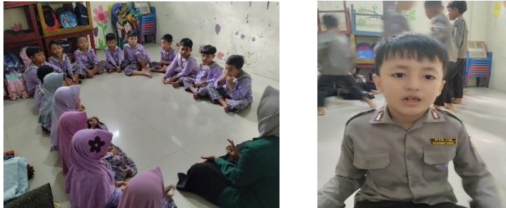
Gambar 4.3 Kegiatan Tindakan Siklus I